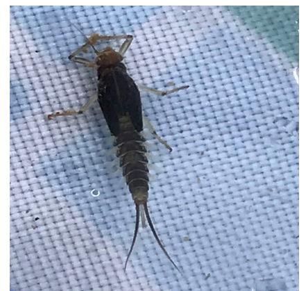
Abbildung 2: Diese Eintagsfliegenlarve hat ihren mittleren Schwanzfaden verloren.